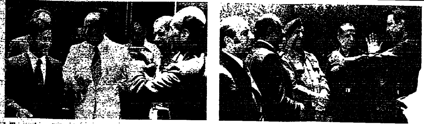
العماد غانم ، والعماد نصرالله ، والنواب ناجي جميل والسيد هشام الشعار في القصر امس

التي اركان النظم الثلاثي أمس على تكليفه بوقف واضح ، وهو ان عودة الاستمرار برهونة باستقالة حكومة العسكريين ويقتضي سرعة ولا بحث في اي حل اخر . وقد استقبل كل من الرئيس سلام ، وكرامي ، طوال النهار ، وقسودا شعبية من بيروت والقاطن ، وجاءت استنوع اشهر للتصويرات ، كما استقبل هدا من النواب والخصم السياسي . الاستقالة اولاً ، وابيخ الرئيس سلام جميع الوفود التي زارته ، انه لا بحث مطلقاً الا باستقالة الحكومة العسكرية الا ، ويعداها يمكن البحث بباقي الامور . ونعم من احدثت سلام انه كان هناك عرض من يصر الى انفاق على صيغة مبنية لطل الازمة ، ثم يصر بعد ذلك الى ترحيل الحكومة ولكن هذا العرض رفض رفضاً باتاً ، وابلغ الذين حاولوا ، انه قبل كل شيء يجب استقالة الحكومة العسكرية ، ويعداها يصري البحث ، ويتم الاتصال على كافة الامور . الطروحة ، وكذا فهم من حيث الرئيس سلام ، ان هذا الموقف هو موقف التحالف والسيد كمال جنبلاط فضلاً عن بعض الهيئات الاخرى .